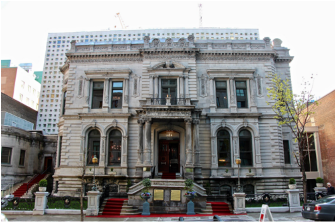
Maison George Stephen, 2017